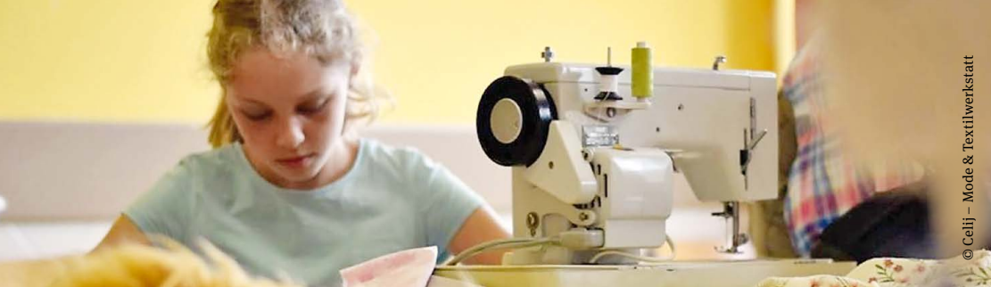
© Celij - Mode & Textilwerkstatt